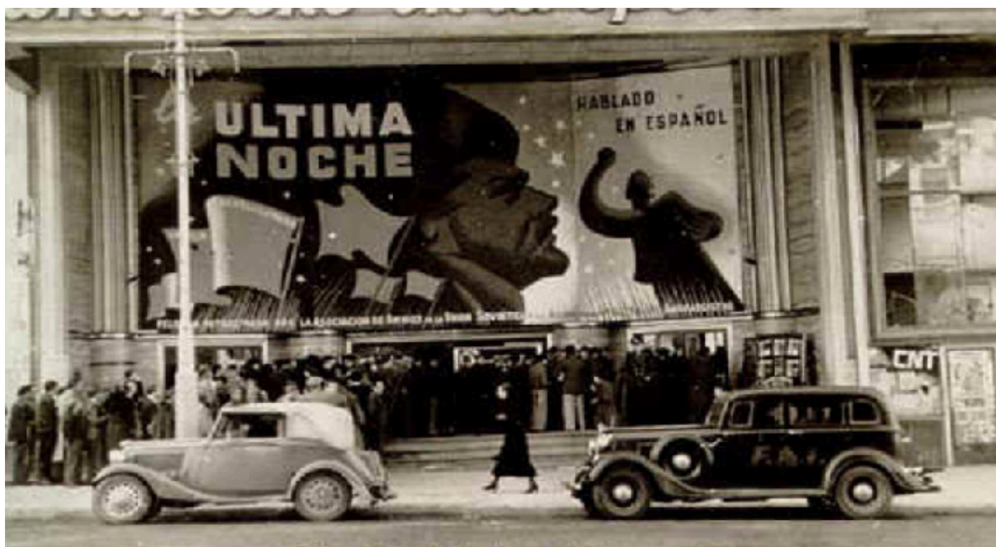
El cine Capitol de Madrid durante la guerra civil